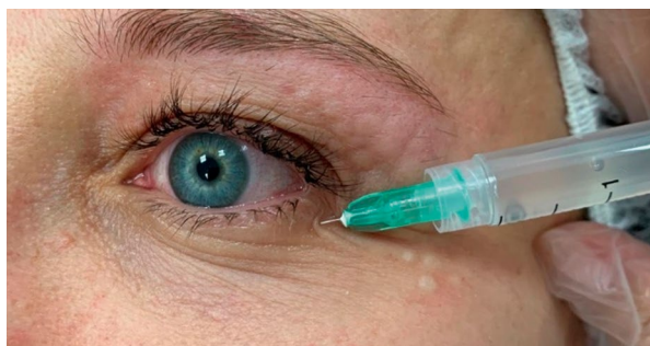
Возможность терапии кожи верхнего и нижнего века до ресниччатого края