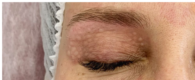
Возможность терапии кожи верхнего и нижнего века до реснитчатого края