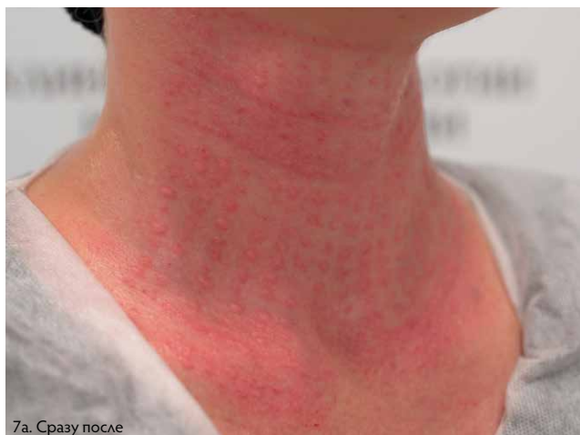
7a. Сразу после