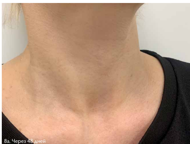
8a. Через 48 дней