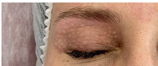
Возможность терапии кожи верхнего и нижнего века до ресниччатого края